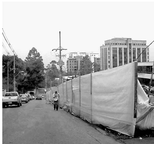
La obra tiene límites en tela para los escombros, pero no bastan.

Se debe hacer valer el derecho ciudadano al buen uso del espacio público y a la defensa del medio ambiente, más aun cuando el asunto puede perjudicar al peatón.