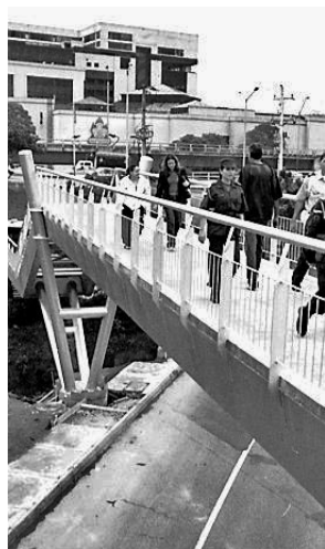
La Policía realiza una amonestación por escrito a quien vea orinando en el espacio público.

Cada cosa cumple su papel, y no es el de una estación de transporte ser el orinal de las personas irrespetuosas y desaseadas.